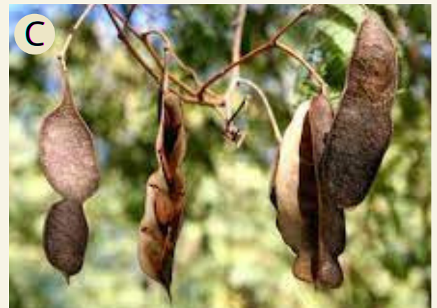
Fig. 7 A) Copa de árbol joven. Fuente: Achával Aylén (2022) B) Floración. C) Frutos. Fuente: semanticscholar.org