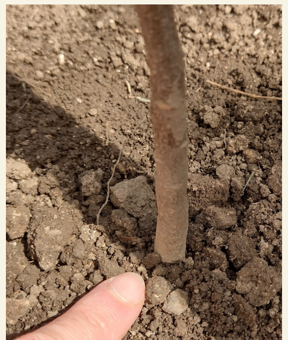
Fig. 15 Cuello unión del tallo con la raíz.