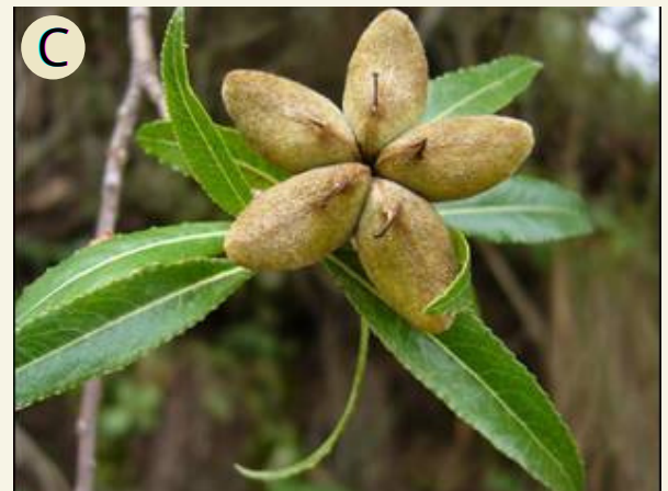
Fig. 3 A) Copa de árbol adulto. Achával Aylén (2022). B) Floración. C) Fruto.