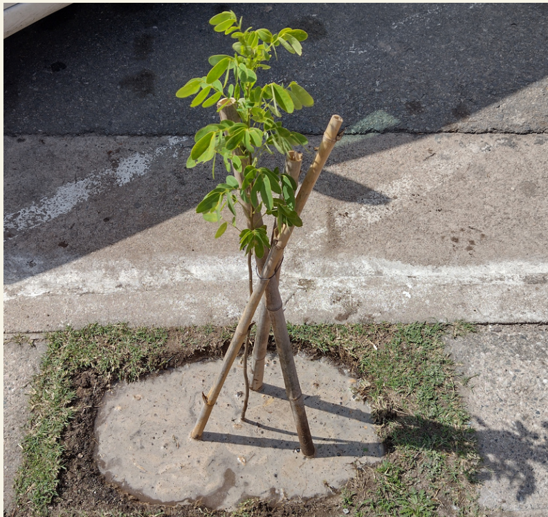
Fig. 17 Riego de asiento.