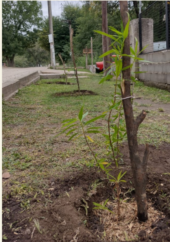
Fig. 8 Plantación de arbolado urbano distanciado cada 5 metros.