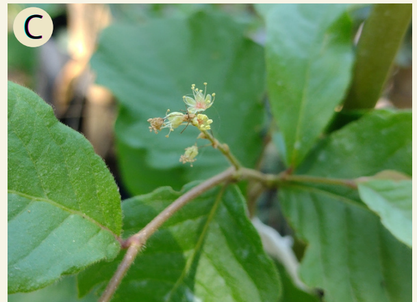
Fig. 1 A) Copa de árbol adulto. B) Flor femenina. C) Flor masculina.