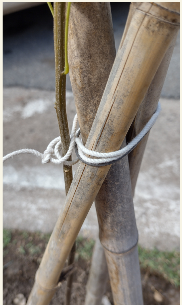
Fig. 16 Cuello unión del tallo con la raíz.