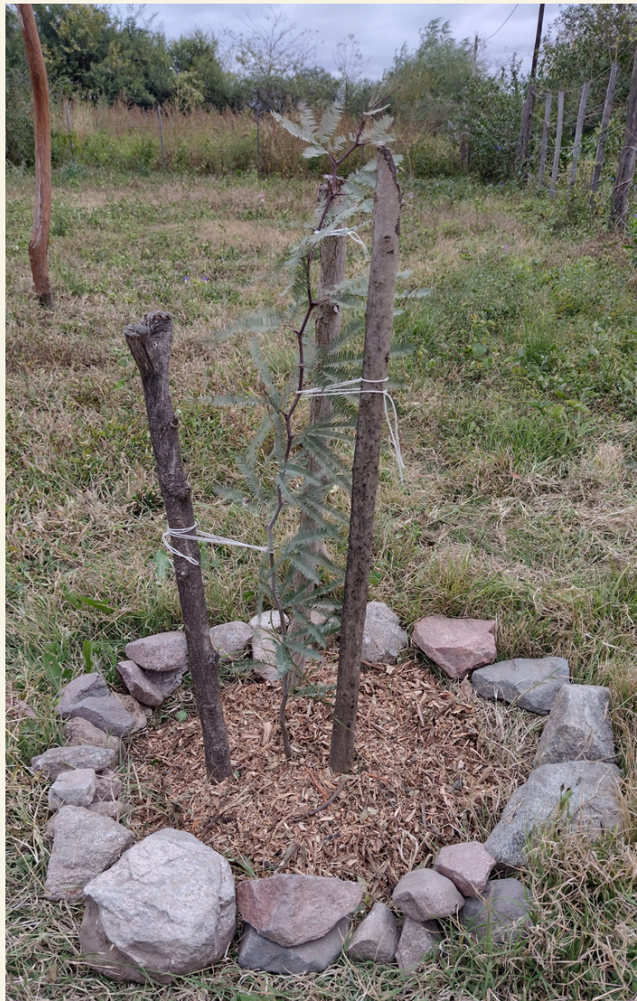
Fig. 18 Capa de mulch.