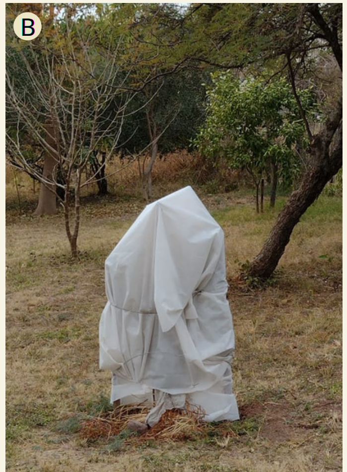
Fig. 21 A y B) Protección contra heladas.