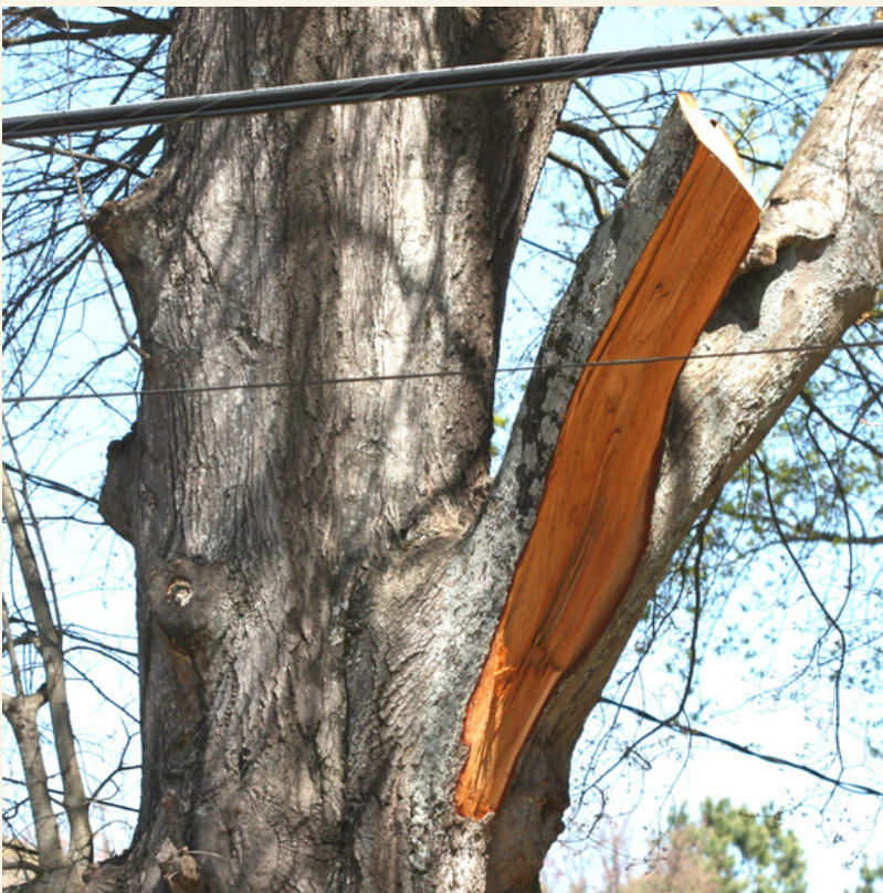
Fig. 23 Poda que provocó rajadura en la rama .