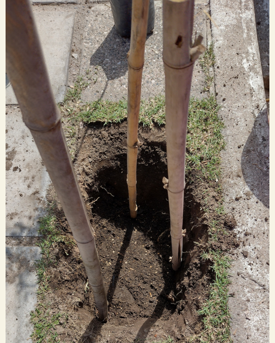
Fig. 11 Colocación de tutores.