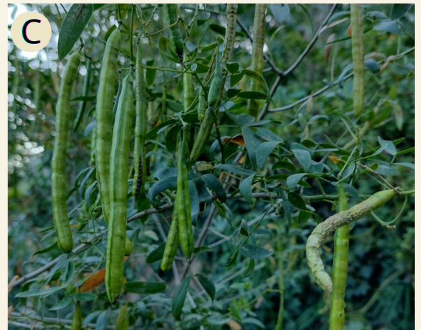
Fig. 5 A) Copa del arbusto. Frutos Nicolás (2022). B) Floración. C) Frutos.