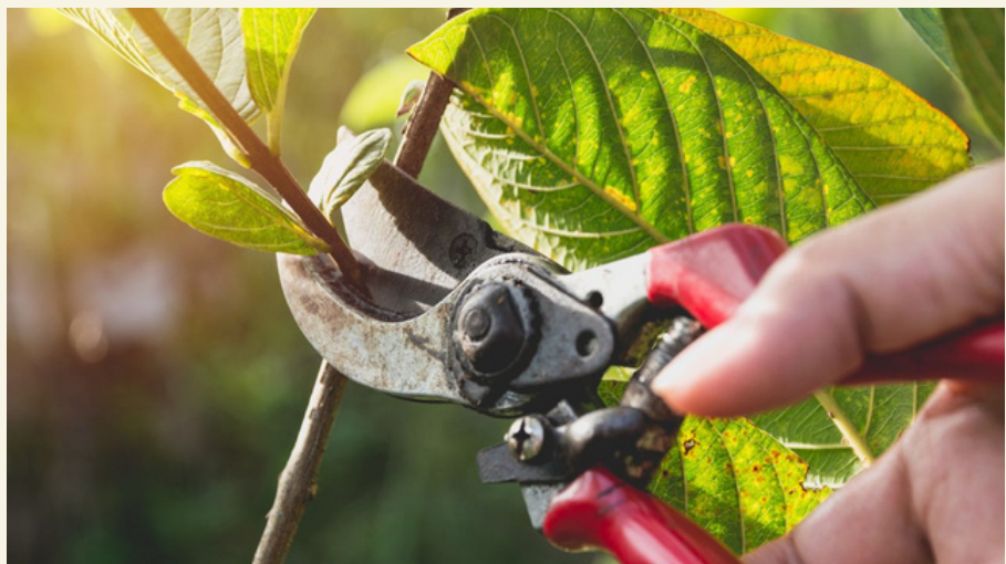
Fig. 22 Poda de formación.