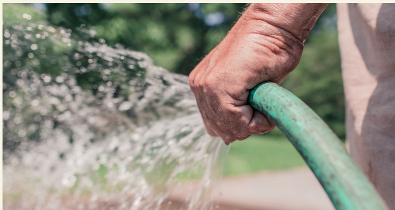
Fig. 19 Riego. Canva (2022).