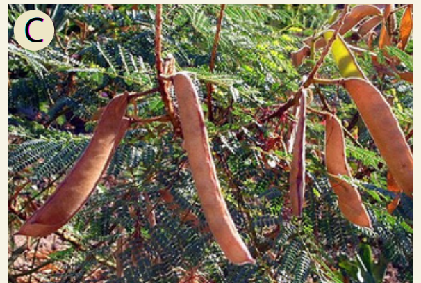
Fig. 6 A) Copa del arbusto. B) Floración. Fuente: C) Frutos. Fuente: Achával Aylen (2022).