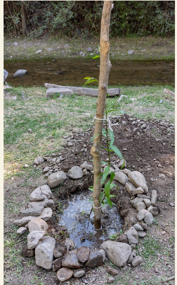
Fig. 10 Cazuela de piedras.