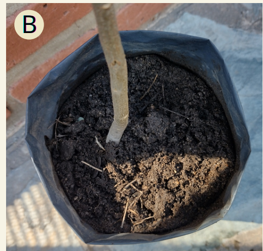
Fig. 9 A) Envase forestal de 25 cm de largo. B) Envase con 10 cm de diámetro.