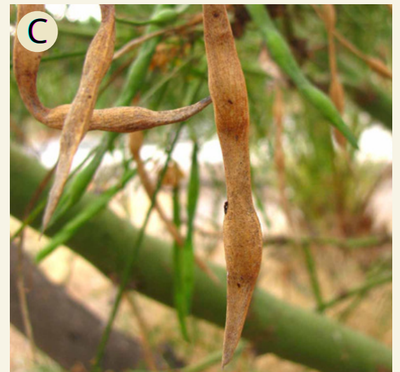
Fig. 4 A) Copa de árbol adulto. B) Floración. C) Fruto.