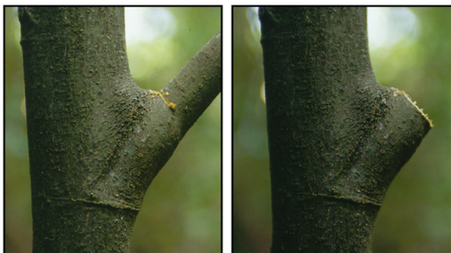
Fig. 25. Corte al ras del tronco.